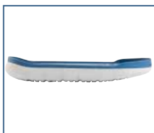
79022 SBI Stabil rullsula (S - XXL)