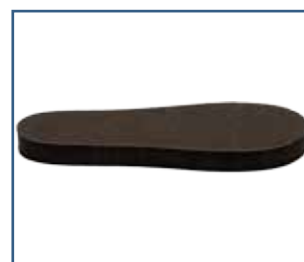
79026 SBI Inlägg enkelt svart (S - XXL)