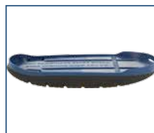
79023 SBI Total rullsula (S - XXL)