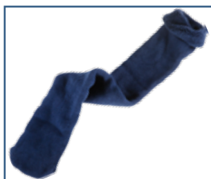
79027 Tubstrumpa utan sömmar (En storlek)